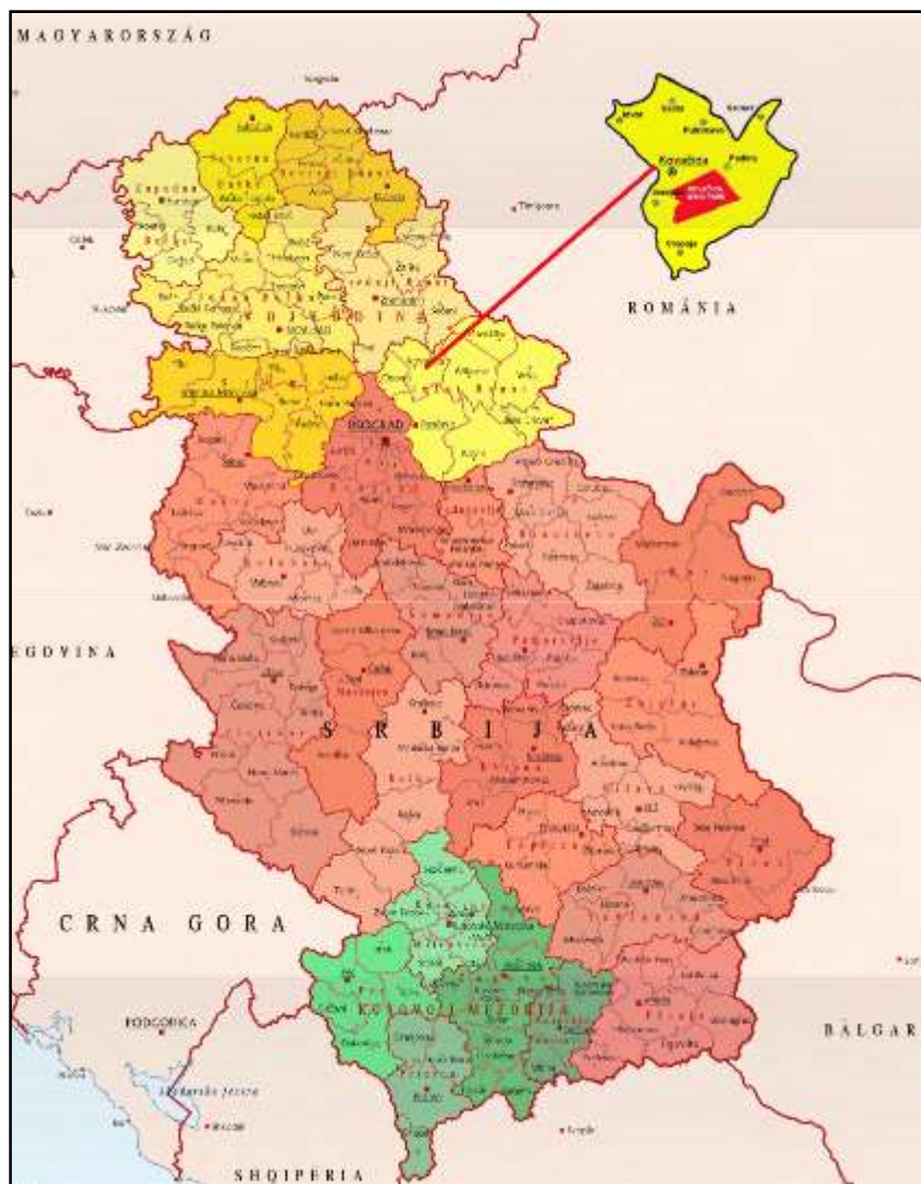
Slika 1 - Lokacija projekta